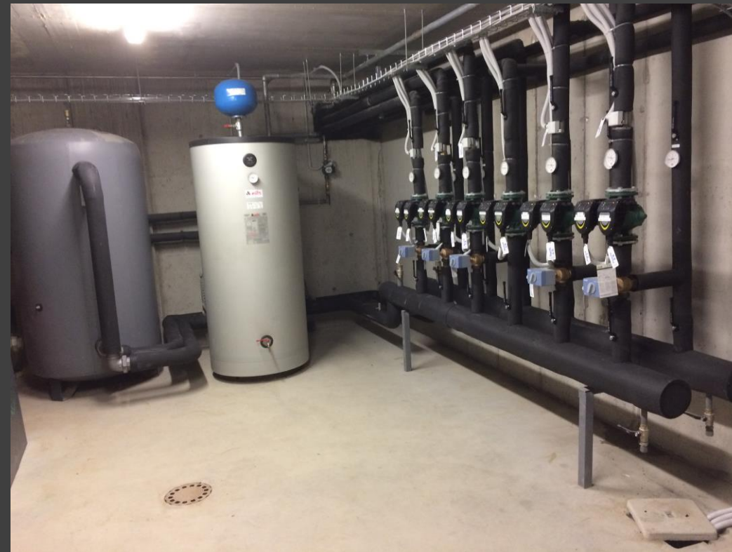
Centrale termofrigorifera scuola elementare di Nerviano (MI)