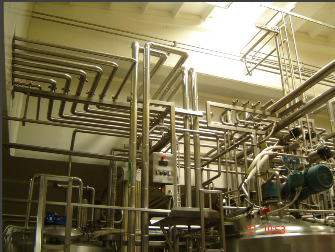
RACHELLI S.p.A. – Piping