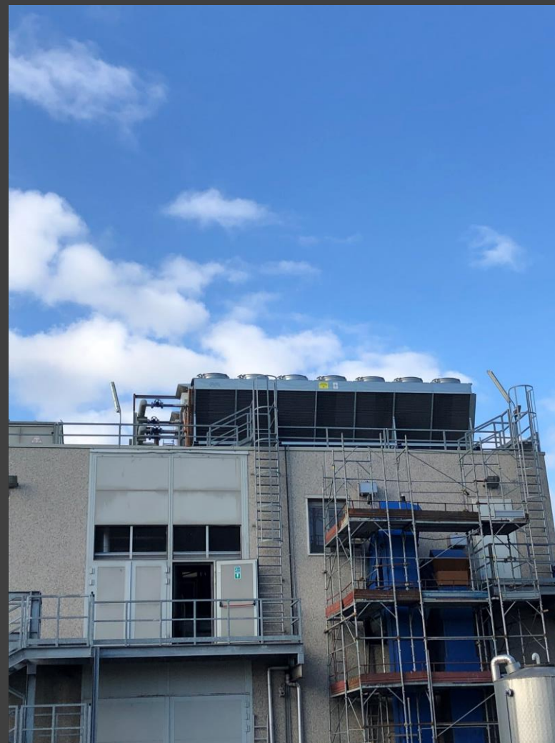
PROMETHEUS ENERGIA S.r.l. – Aero-termo dissipatore di calore turbina