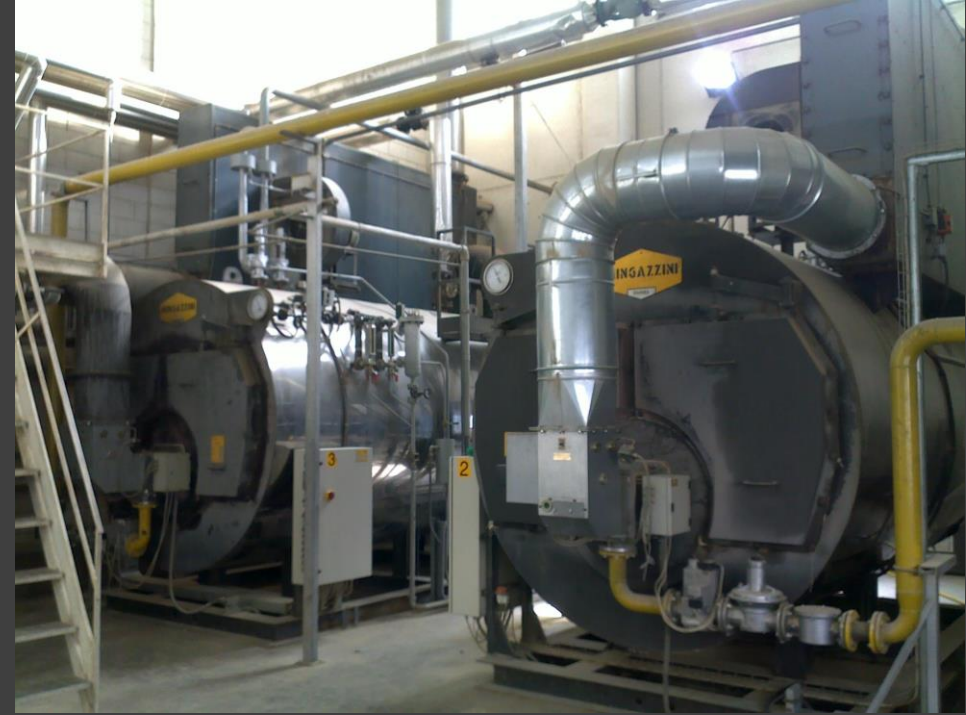
RISO SCOTTI S.p.A. – Centrale termica con caldaie a vapore