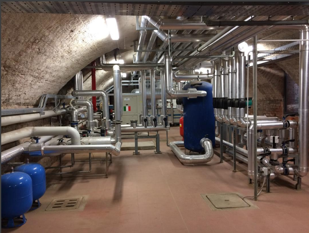
Centrale termofrigorifera ex convento S. CLARA - Pavia