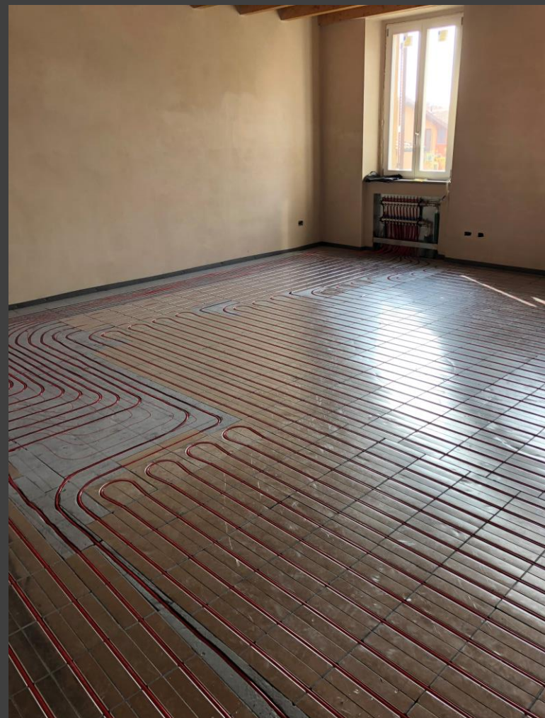
Impianto a pannelli radianti con sistema a secco presso appartamenti in Piazza Botta - Pavia