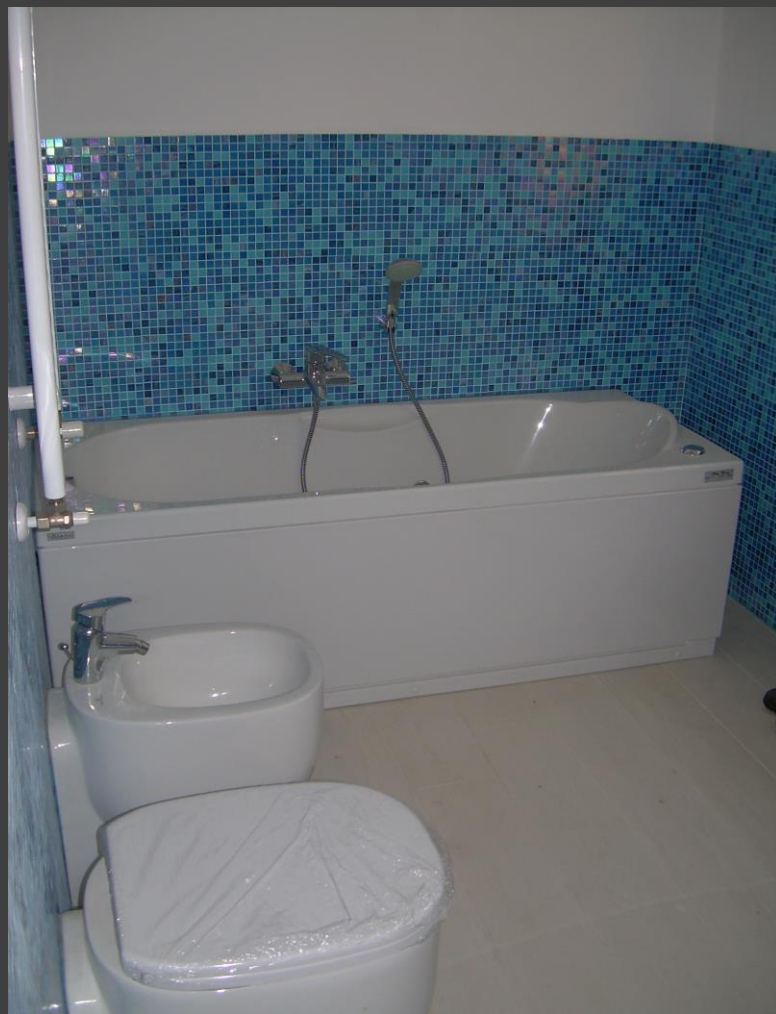
Appartamenti a Santa Margherita Ligure (GE)