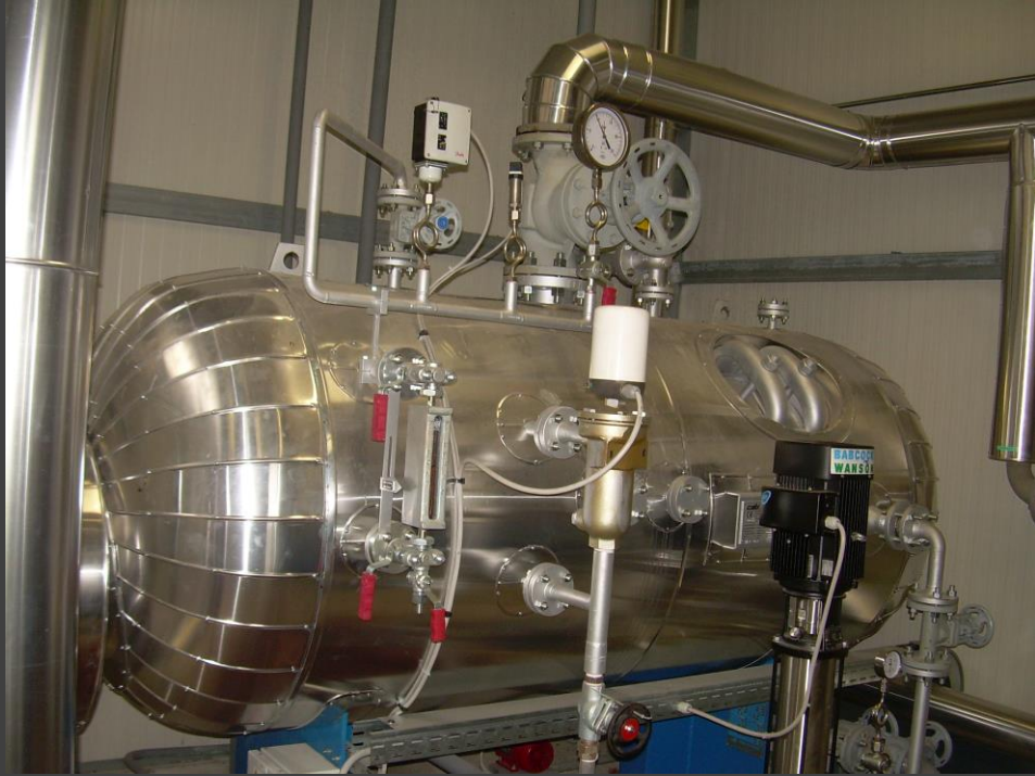
ELIS ITALIA S.p.A. – Centrale termica stabilimento di Fiano Romano (RM)